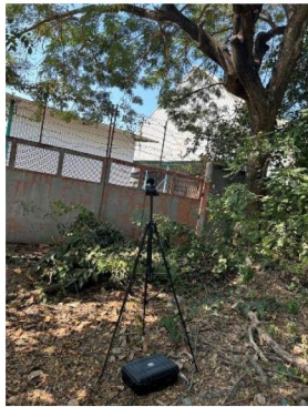
บ้านที่ติดโรงงานมากที่สุดทางทิศใต้ของโรงไฟฟ้า