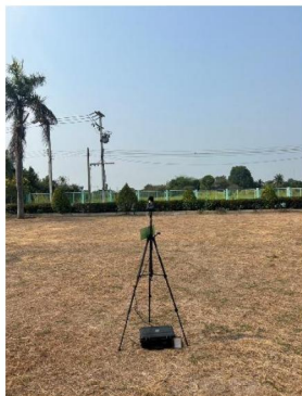
โรงพยาบาลส่งเสริมสุขภาพตำบลบ้านมะเกลือ