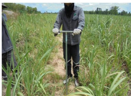
จุดที่ 10 กลุ่มชุดดินที่ 49