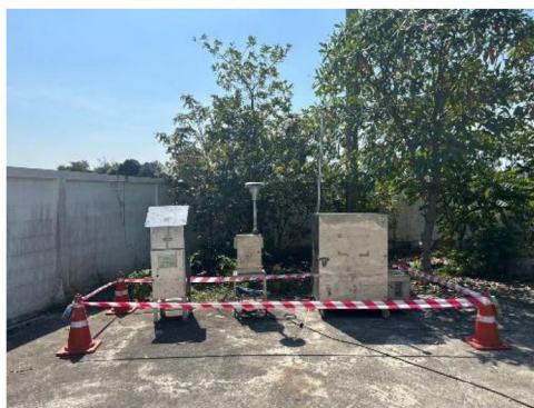
โรงพยาบาลส่งเสริมสุขภาพตำบลบ้านมะเกลือ