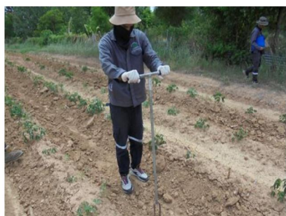
จุดที่ 7 กลุ่มชุดดินที่ 35