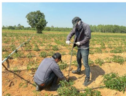
จุดที่ 5 กลุ่มชุดดินที่ 29