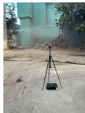
ริมรั้วโรงงานด้านทิศเหนือของโรงไฟฟ้า