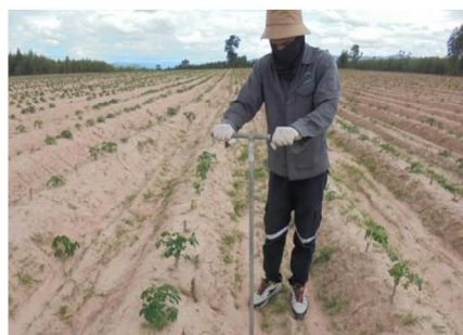
จุดที่ 11 กลุ่มชุดดินที่ 56