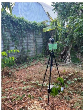
บ้านที่ติดโรงงานมากที่สุดทางทิศใต้ของโรงไฟฟ้า