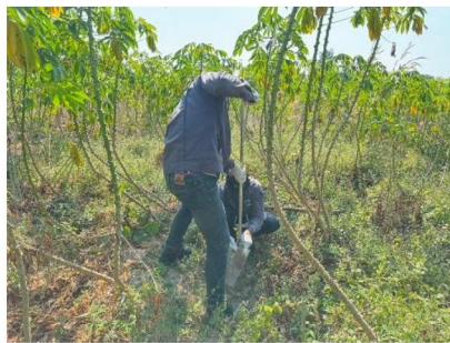
จุดที่ 2 กลุ่มชุดดินที่ 17