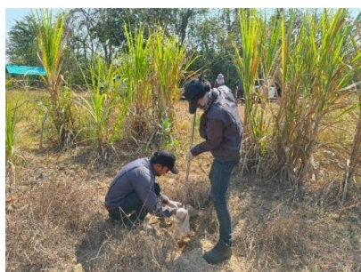
จุดที่ 8 กลุ่มชุดดินที่ 36