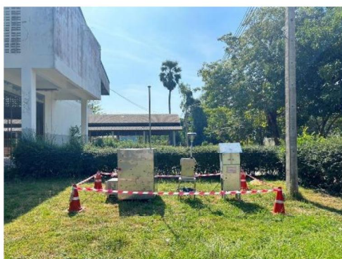
โรงเรียนบ้านแก่งชัยวิติวิทยา