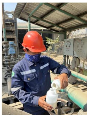
เดือนพฤศจิกายน 2567