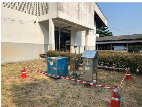
โรงเรียนบ้านแก่งชัยวิติวิทยา