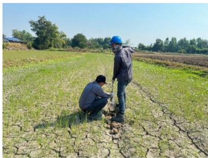
จุดที่ 1 กลุ่มชุดดินที่ 5