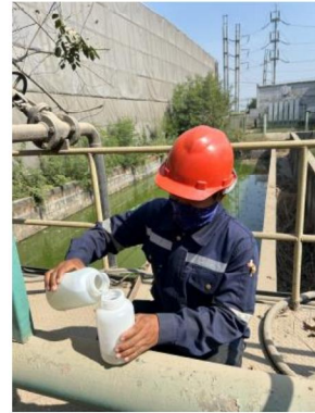
เดือนสิงหาคม 2567