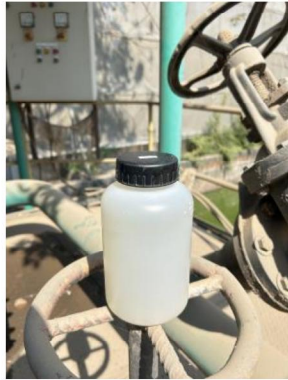
เดือนกรกฎาคม 2567