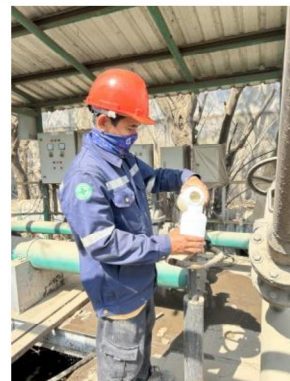
เดือนตุลาคม 2567