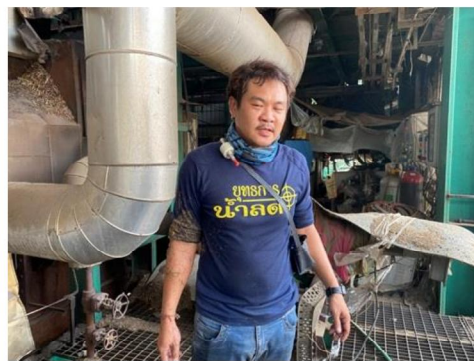
บริเวณหม้อไอน้ำ