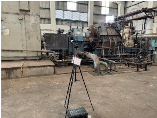
บริเวณอาคารเครื่องกำเนิดไฟฟ้ากังหันไอน้ำ