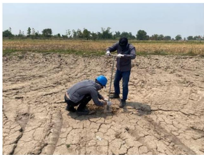
จุดที่ 1 กลุ่มชุดดินที่ 5