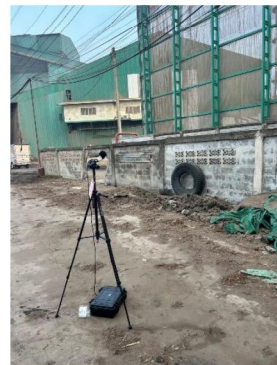
บ้านที่ติดโรงงานมากที่สุดทางทิศเหนือของโรงไฟฟ้า