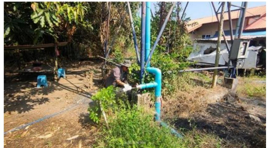
บริเวณบ้านวังยาง