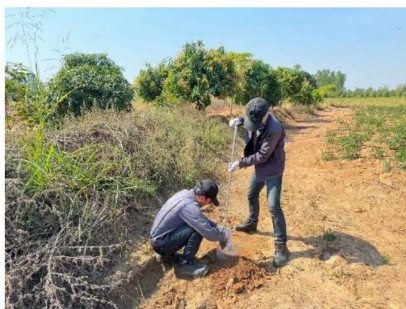
จุดที่ 4 กลุ่มชุดดินที่ 24