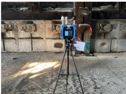
วันที่ 26 ธันวาคม 2566