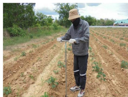
จุดที่ 6 กลุ่มชุดดินที่ 31