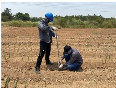
จุดที่ 4 กลุ่มชุดดินที่ 24