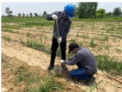
จุดที่ 8 กลุ่มชุดดินที่ 36