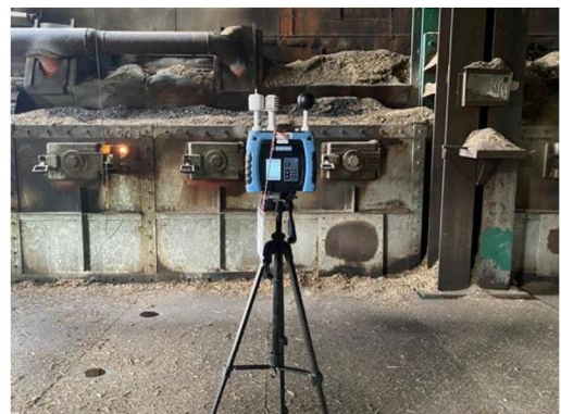
วันที่ 2 พฤษภาคม 2567