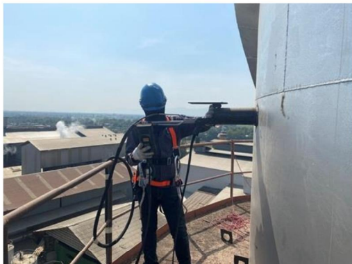
ปล่องหม้อไอน้ำ (Normal Operation)