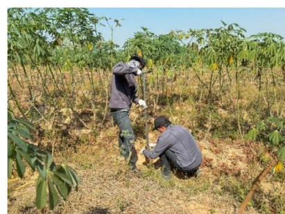
จุดที่ 11 กลุ่มชุดดินที่ 56