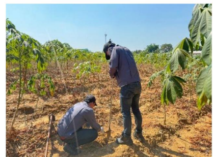
จุดที่ 6 กลุ่มชุดดินที่ 31