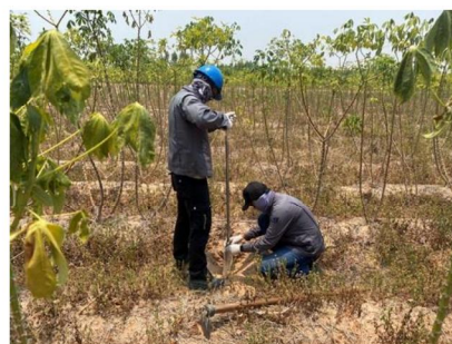
จุดที่ 11 กลุ่มชุดดินที่ 56