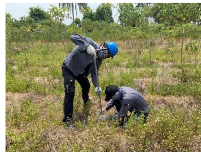
จุดที่ 3 กลุ่มชุดดินที่ 19