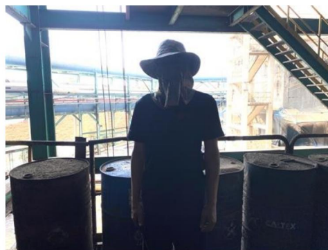
บริเวณระบบสายพานลำเลียงขานอ้อย