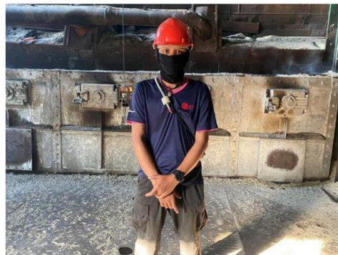
บริเวณระบบสายพานลำเลียงขานอ้อย