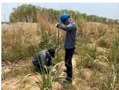
จุดที่ 10 กลุ่มชุดดินที่ 49