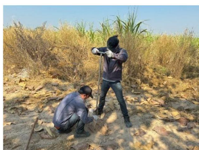
จุดที่ 10 กลุ่มชุดดินที่ 49