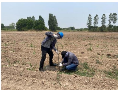
จุดที่ 5 กลุ่มชุดดินที่ 29