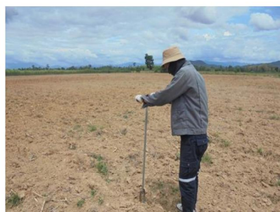
จุดที่ 9 กลุ่มชุดดินที่ 40