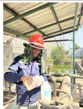
เดือนธันวาคม 2567