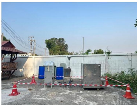
โรงพยาบาลส่งเสริมสุขภาพตำบลบ้านมะเกลือ