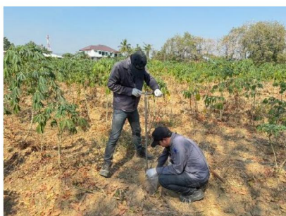
จุดที่ 7 กลุ่มชุดดินที่ 35