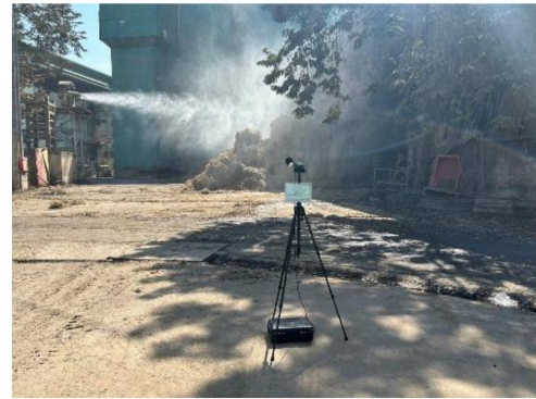
ริมรั้วโรงงานด้านทิศเหนือของโรงไฟฟ้า