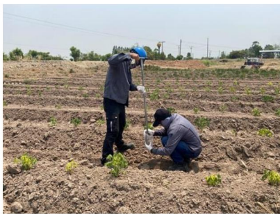
จุดที่ 2 กลุ่มชุดดินที่ 17