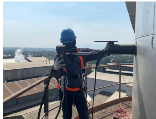
ปล่องหม้อไอน้ำ (Soot blow)