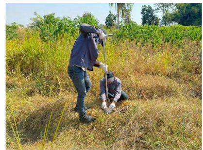
จุดที่ 3 กลุ่มชุดดินที่ 19