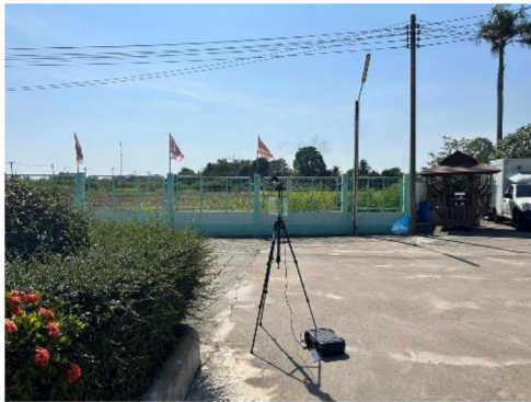
โรงพยาบาลส่งเสริมสุขภาพตำบลบ้านมะเกลือ