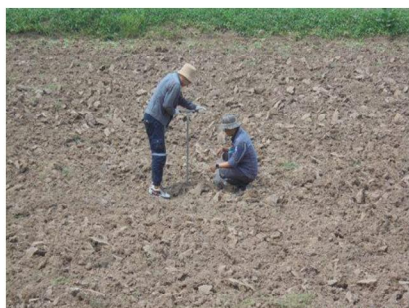
จุดที่ 1 กลุ่มชุดดินที่ 5