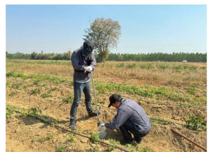
จุดที่ 9 กลุ่มชุดดินที่ 40