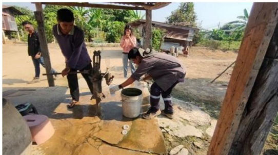
บริเวณบ้านมะเกลือ