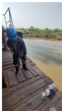
วันที่ 19 ธันวาคม 2567