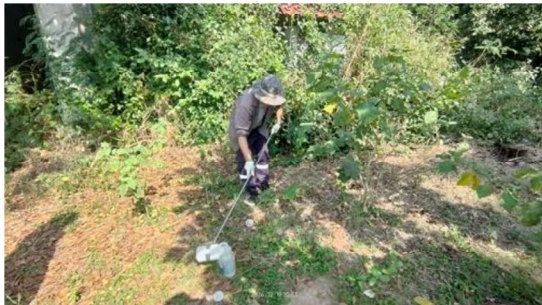
บริเวณโรงเรียนบ้านแก่งซั่วลิตวิทยา