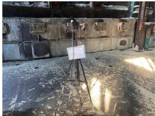
บริเวณหม้อไอน้ำ