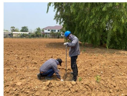
จุดที่ 6 กลุ่มชุดดินที่ 31