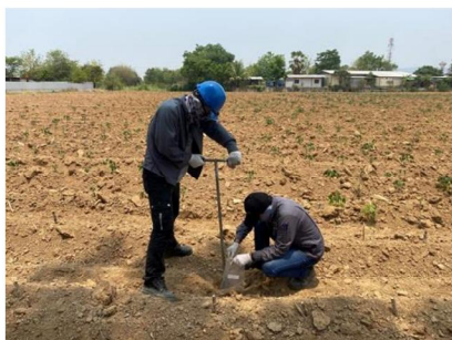
จุดที่ 7 กลุ่มชุดดินที่ 35