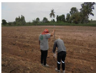
จุดที่ 4 กลุ่มชุดดินที่ 24