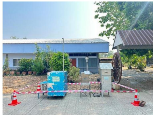
โรงเรียนวัดยางงาม