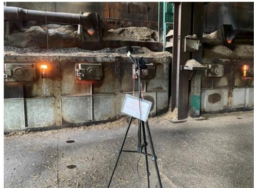
บริเวณหม้อไอน้ำ