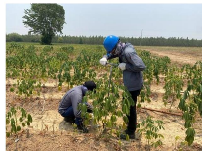
จุดที่ 9 กลุ่มชุดดินที่ 40