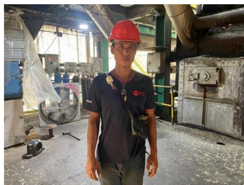
บริเวณหม้อไอน้ำ