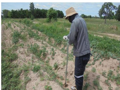
จุดที่ 2 กลุ่มชุดดินที่ 17