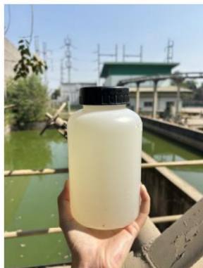
เดือนกันยายน 2567