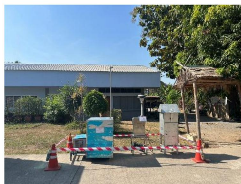
โรงเรียนวัดยางงาม