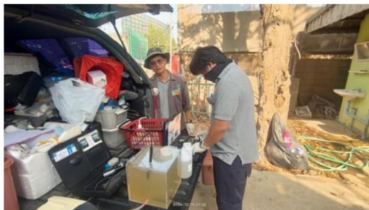
บ่อ Monitoring Well บริเวณระบบบำบัดน้ำเสีย