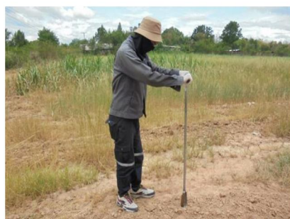
จุดที่ 8 กลุ่มชุดดินที่ 36