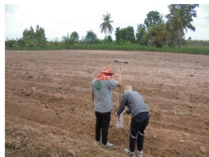
จุดที่ 3 กลุ่มชุดดินที่ 19