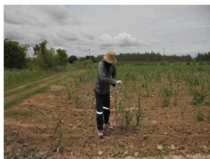
จุดที่ 5 กลุ่มชุดดินที่ 29