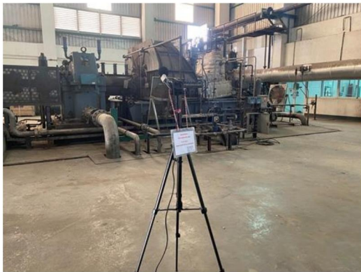
บริเวณอาคารเครื่องกำเนิดไฟฟ้ากังหันไอน้ำ