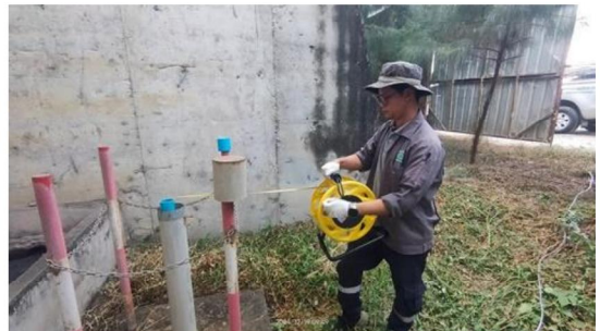
บ่อ Monitoring Well บริเวณลานกองขานอ้อย