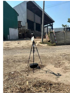
บ้านที่ติดโรงงานมากที่สุดทางทิศเหนือของโรงไฟฟ้า